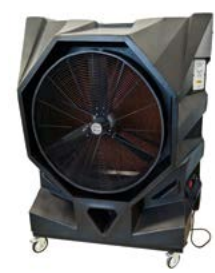
Master BC 340