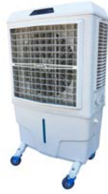
Master BC 80