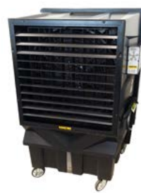
Master BC 180