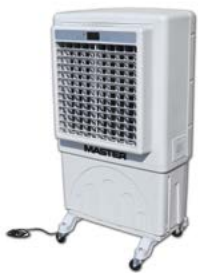
Master BC 60